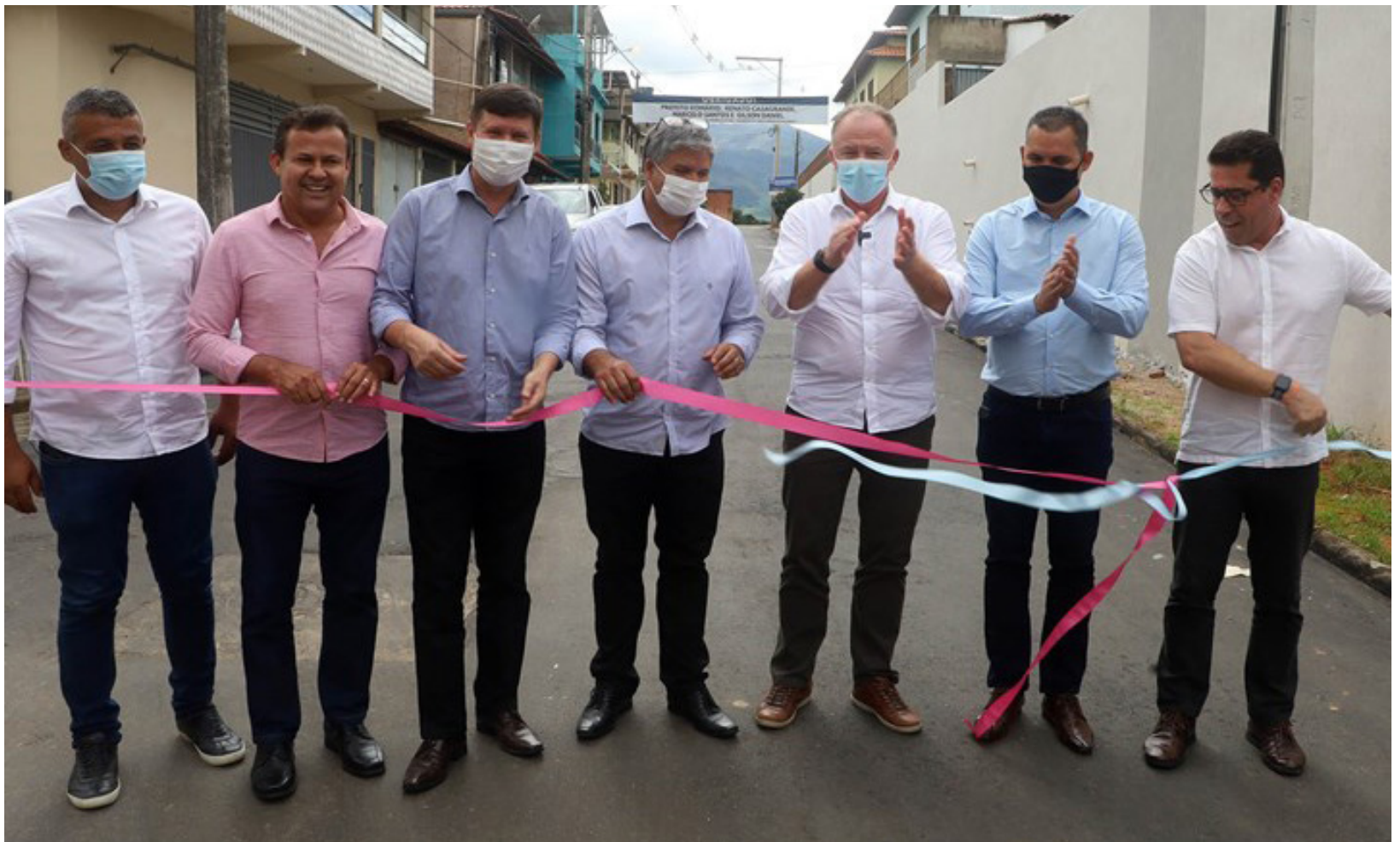
HÉLIO FILHO / SECOM

percorreu as ruas de lúna, falando com moradores e comerciantes, além de visitar obras em andamento. O município também recebeu as obras de Calçamento Rural nas comunidades de Lamim, Café do Príncipe e Estrada Uberaba, totalizando mais de R$ 1,7 milhão em investimentos. Página 3